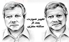
تغییر صورت بعد از سکته مغزی